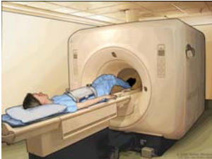
© 2005 Terese Winslow, U.S. Govt. has certain rights

ዳይጎኖስቲክ ምርመራዎች (Diagnostic tests) በሕመም ስሜቶች ምክንያት የጡት ካንሰር መኖሩ ከተጠረጠረ የሚደረግ ምርመራ ነው። አንደኛው የዲያግኖስቲክ የምርመራ ዓይነት ኤምኦርኦግራፊ ነው። ይህም ኤምኦርኦግራፊ ማግኔትንና ኮምፒተርን በመጠቀም የውስጥ ሰውነትን አጣርቶ የሚያሳይ መሳሪያ ነው። የደም ምርመራና የአጥንት ማንሻ (Bone scan) ደግሞ ሌላ ሁለት ተጨማሪ የዲያግኖስቲክ መመርመሪያ ዘዴዎች ናቸው። እንዲሁም ሚሞግራምና አልትራሳውንድ እንደዚሁ የተለያዩ የዲያግኖስቲክ መመርመሪያዎች ናቸው።