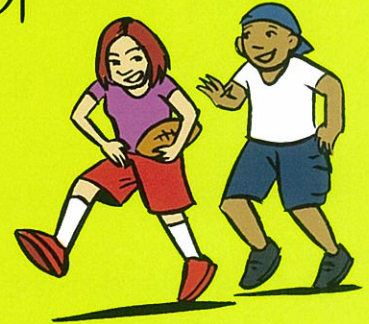
스포츠 활동 하기