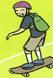
Faasee i le laupapa-faasee