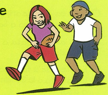
Vili le uila vili-vae