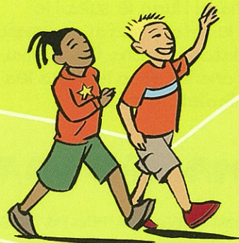
Faavavevave le savali/ tamoemoe