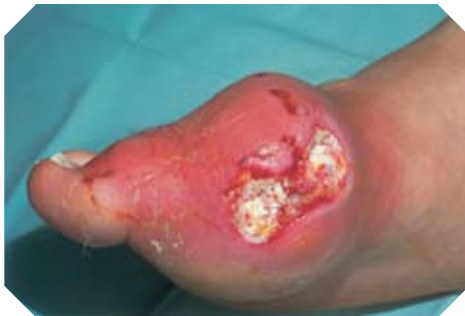
Ko ha palangia 'a e kili' tupu mei' ha fufula mei' he lahi 'a e kauti'

'E ala maumau' i 'e he kauti' ho ngaahi hokotanga-hui' pea mo ho kofuua' kapau 'e 'ikai fai hano faito'o.