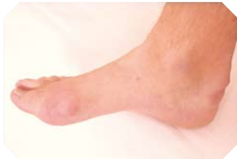
Ko ha fufula tupu mei' he kauti'